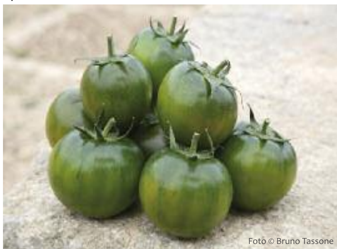
Il pomodoro Camone

Le attività dell'Associazione mirano da un lato a garantire la tipicità delle produzioni e il loro legame con il territorio e le tradizioni agronomiche, culturali e gastronomiche e, dall'altro lato, a sviluppare opportune strategie di interazione tra i soci. Dall'esperienza di www.cucinarericette.it , il primo blog di cucina che raccoglie e diffonde ricette e consigli culinari a base di pomodoro, l'ingrediente principe della dieta mediterranea - e della cucina italiana in particolare - grazie alla sua versatilità e alle innumerevoli possibilità di abbinamento.